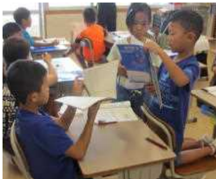
授業で友達と意見交換する2年生 →