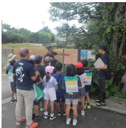
←平和学習で説明を聞く3年生 交流給食を楽しむ4年生→