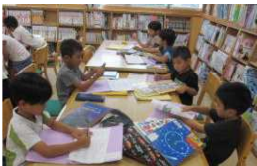
←図書館で勝手に読む1年生