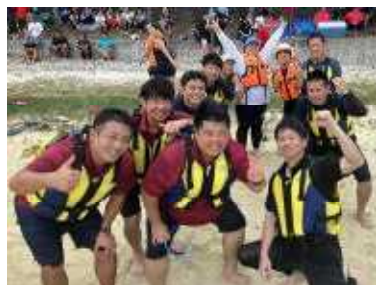
↑ハーリー参加した伊江小PTA